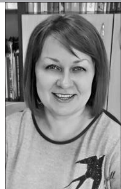
Ученый секретарь Гомельской областной универсальной библиотеки им. В.И. Ленина