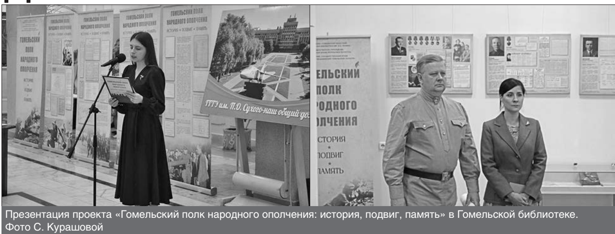
Презентация проекта «Гомельский полк народного ополчения: история, подвиг, память» в Гомельской библиотеке.

Героическая оборона Гомеля легендарной страницей вошла в его историю. Полк народного ополчения храбро держал его 7 дней: с 13 августа до конца дня 19 августа 1941 г., мужественно защищая подступы к городу и прикрывая отход на восток отдельных частей и подразделений советских войск, способствуя сохранению их боеспособности.