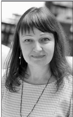
Директор Гомельской областной универсальной библиотеки им. В.И. Ленина