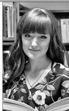
Заведующая детской библиотекой-филиалом № 2 Централизованной системы государственных публичных библиотек г. Могилева