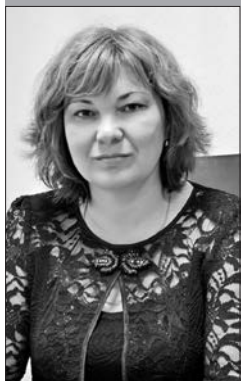
Директор Централизованной системы государственных публичных библиотек г. Могилева