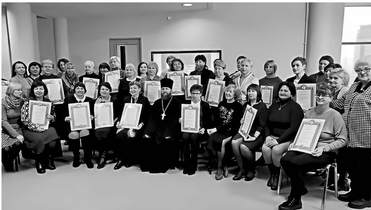
Победители IX Республиканского конкурса «Библиотека – центр духовного просвещения и воспитания», занявшие II и III места во всех номинациях

В соответствии с Инструкцией о порядке проведения Республиканского конкурса «Библиотека – центр духовного просвещения и воспитания» (в редакции от 01.09.2022 г.), лучшие работы из всех регионов Беларуси приняли участие в конкурсном отборе на областном и ведомственном уровнях. Ра-