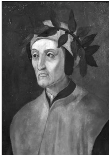
Данте Алигьери (1265–1321)