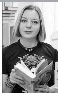
Заведующая сектором Астраханской центральной городской библиотеки

Функции современной библиотеки давно не ограничиваются выдачей книг. Сегодня библиотека – это многоцелевое пространство, где можно получить знания, провести культурный досуг, реализовать свою идею и найти единомышленников. Благодаря тому, что библиотеки выступают как центр притяжения творческих партнеров, при них зачастую образовывается актив талантливых людей, которым она позволяет расти профессионально.