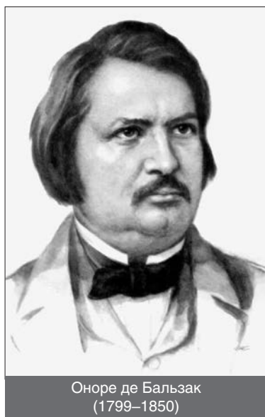
Оноре де Бальзак (1799–1850)