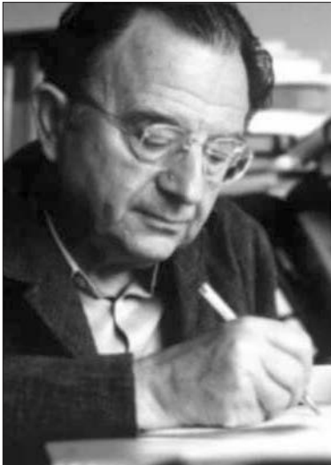
Эрих Фромм (1900–1980)