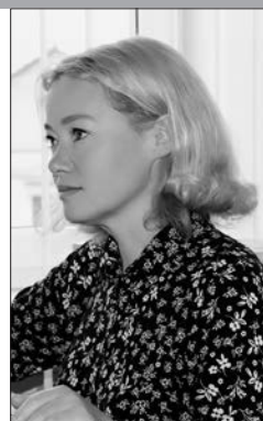
Библиотекарь Ивьевской районной библиотеки