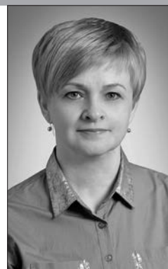
Загадчык сектара Ушацкай раённай бібліятэкі імя Е.Я. Лось