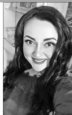
Загадчык аддзела Гродзенскай абласной навуковай бібліятэкі імя Я.Ф. Карскага

The article presents the experience of organizing summer employment for teenagers in the Ilye regional library.