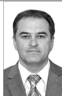
Генеральный директор ООО «Дата Экспресс», канд. экон. наук

Автоматизированная библиотечная информационная система (АБИС) является основным программным средством, обеспечивающим автоматизацию технологических процессов, создание информационных ресурсов и управление ими, предоставление информационных сервисов для читателей. АБИС ориентированы на одну целевую аудиторию и имеют много общих черт. У среднестатистического библиотекаря может создаться впечатление, что разные АБИС мало отличаются друг от друга либо имеют незначительные отличия. Однако это является большим заблуждением, без преодоления которого библиотека может упустить критически важные моменты, напрямую относящиеся к ее дальнейшему развитию и конкурентоспособности.