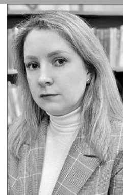
Заведующая отделом Централизованной системы государственных публичных библиотек г. Могилева

Одним из главных условий реализации духовно-нравственного воспитания подрастающего поколения для библиотек является объединение усилий и координация деятельности различных организаций, в первую очередь, культурных. Результатом такого взаимодействия стала программа духовно-нравственного развития «Духовность. Книга. Свет», целью которой является формирование устойчивой мотивации учащихся к познанию православной литературы, развития познавательных и созидательных способностей личности. Ведь непосредственно через книгу можно оказывать огромное влияние на человека, формировать полноценную личность, раскрывать духовно-эмоциональный и интеллектуальный потенциал.