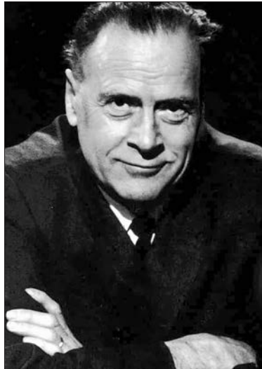
Герберт Маршалл Маклюэн (1911–1980)