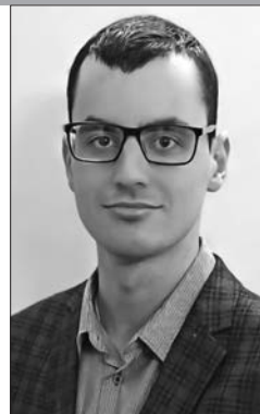
Библиотекарь Гомельской областной универсальной библиотеки им. В.И. Ленина

Сотрудники отдела редкой книги Гомельской областной универсальной библиотеки им. В.И. Ленина проводят тематические мероприятия с образовательно-просветительской целью. Организуются различные лекции, мастер-классы, а также разнообразные выставки, раскрывающие богатейшие фонды библиотеки. Одним из таких мероприятий стала выставка «Провененции: книги и судьбы», впервые открывшаяся 20 октября 2022 г., где представлены издания отдела редкой книги.