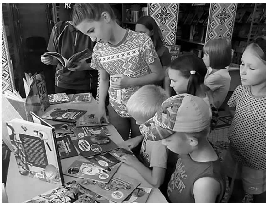
Летняя літаратурная экспедыцыя «Жывуць на свеце кніжкі»

абходнай інфармацыі вялікай колькасці карыстальнікаў. Звесткі аб рабоце Александрыйскай сельскай бібліятэкі рэгулярна размяшчаюцца на сайце Шклоўскай бібліятэчнай сеткі ( http://lib-shklov.mogilev.by/ ). Бібліятэка вядзе сваю старонку ў сацыяльнай сетцы «ВКонтакте» ( https://vk.com/public212613943 ), дзе змяшчае інфармацыю аб праведзеных мерапрыемствах, фотаздымкі ўдзельнікаў і пераможцаў творчых конкурсаў, рэкламныя відэаролікі.