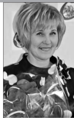
Дырэктар Цэнтралізаванай бібліятэчнай сеткі Шклоўскага раёна