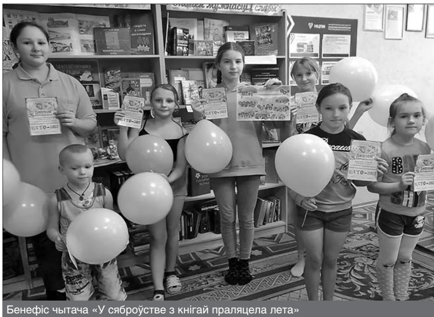
Бенефіс чытача «У сяброўстве з кнігай праляцела лета»

работы адрозніваюцца крэатыўнасцю, нясуць шчырыя эмоцыі і пазітыў. Калектыўныя работы членаў аматарскага аб'яднання накіраваны на згуртаванне дзяцей, навучанне сумеснай творчай дзейнасці: «У пошуках папараць-кветкі», «Восеньская пара». Тэме малой радзімы прысвечана дэкаратыўная кампазіцыя «Мая Александрыя», выкананая ў тэхніцы вышыўкі злічальным крыжам. У цэнтры кампазіцыі знаходзіцца Дрэва жыцця, якое сімвалізуе сувязь са сваім родам і пачатак новага жыцця. Да Дня беларускай вышыванкі агульнымі намаганнямі створана дэкаратыўнае пано «Слухай родную мову». У час работы над пано дзеці даведаліся пра асаблівасці беларускага касцюма, навучыліся адрозніваць асобныя элементы вышыўкі і іх значэнне. Нездарма «АРТ-ДЭКОР» – актыўны ўдзельнік і неаднаразовы прызёр раённых, абласных, рэспубліканскіх і міжнародных творчых