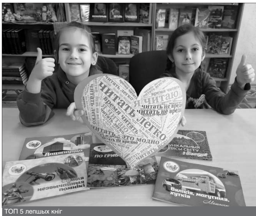
ТОП 5 лучших книг

Варта звярнуць увагу на тое, што ў 2022 г. распрацаваны інавацыйны праект летніх чытанняў «КНИГОсветное путешествие», які складаецца з дзевяці маршрутаў. Удзельнікі чытанняў атрымалі «Карту маршрутов литературных круизов», спіс кніг для чытання і творчыя заданні па прачытаных кнігах у выглядзе віктарын і крыжаванак. Чытацкія фармуляры ўдзельнікаў пазначаліся спецыяльным знакам-індыкатарам. За кожнае мерапрыемства ўдзельнікі праекта атрымлівалі вясёлы смайлік-чытайлік. Каб маршруты «Кнігасветнага падарожжа» сталі пазнавальнымі для дзяцей, былі арганізаваны квэст-гульні «По следам любимых книжек», «Книжные детективы», бібліятэчны фестываль «Разноцветные Холи-краски», акцыя