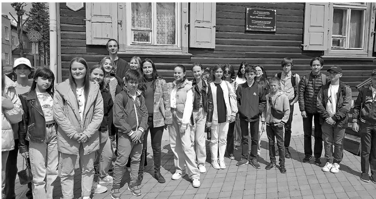
Экскурсія «Мемарыяльны Гродна»

Збор звестак пра асоб і падзеі, якім прысвечаны аб'екты манументальнай скульптуры ў Гродне, пачалі яшчэ ў 2019 г. Паўсталі пытанні, якія датычыліся храналогіі ўстаноўкі, фактаў біяграфій асоб, геаграфічных і гістарычных звестак. Для адказаў на іх патрэбна было працаваць у музеях і архівах горада. Дапамогу ў пошукавай працы аказвалі ўстановы і прадпрыемствы горада. Пасля карпатлівай даследчай работы быў выдадзены біябібліяграфічны даведнік «Памяць горада Гродна ў манументальнай скульптуры» (асобы і падзеі), створаны электронны інфармацыйны рэсурс (ЭІР) «Манументальная памяць горада Гродна» з наяўнасцю картаграфічнага і фотаматэрыялу ( http://centrbibl.grodno.by/ ).