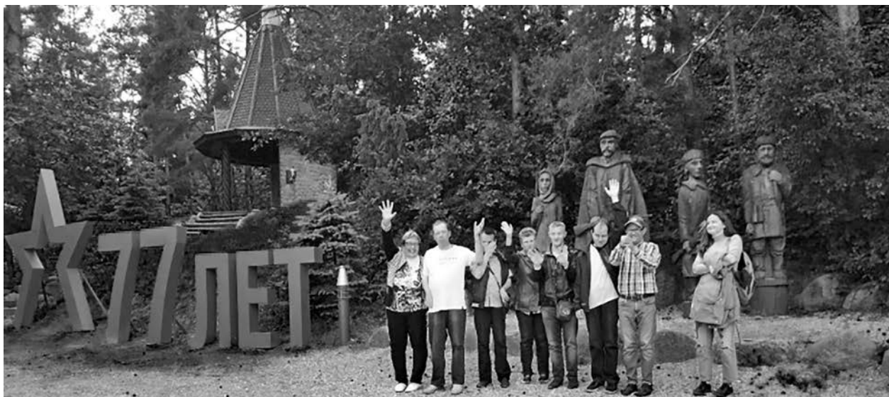
Экскурсія «Дарогай памяці»

У 2022 г. на аснове сабраных матэрыялаў гродзенскія бібліятэкары паспяхова рэалізавалі маштабны краязнаўчы экскурсійны праект «Гістарычныя падзеі ў мемарыяльных дошках Гродна». Сваю працу яны прысвяцілі Году гістарычнай памяці ў Рэспубліцы Беларусь. У межах экскурсійнага праекта арганізавалі 30 экскурсій па горадзе і яго ваколіцах. Сярод іх – 10 інклюзіўных гістарычных вандровак і 20 краязнаўчых экскурсій для навучэнцаў школ, гімназій, каледжаў і студэнтаў устаноў вышэйшай адукацыі.