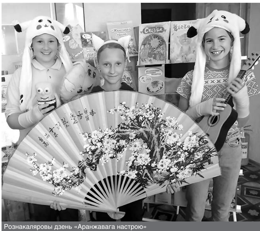
Рознакаляровы дзень «Аранжавага настрою»

Безумоўна, на сённяшні дзень дзейнасць бібліятэкі немагчыма без выкарыстання сучасных інфармацыйных тэхналогій і інтэрнэт-прасторы, якія забяспечваюць доступ да не-