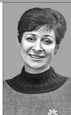
Ведущий библиотекарь Брестской областной библиотеки им. Максима Горького