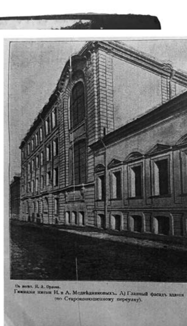
Общ. В. А. Жуков. Гимназия имени И. А. Мухоморова. А) Главный фасад здания (по Старокошечинскому переулку).