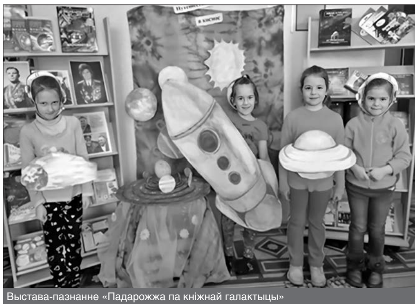
Выстава-пазнанне «Падарожжа па кніжнай галактыцы»

Праходзяць цікавыя мерапрыемствы з мэтай знаёмства з гісторыяй і традыцыямі святкавання Купалля. Мінным летам тут прайшоў бібліяквэст «Купальская ноч». Удзельнікі мерапрыемства ў гульнівай форме пазнаёміліся з традыцыямі нашых продкаў, іх адносінамі да прыроды, а таксама з міфічнымі істотамі, прысутнымі ў асяроддзі беларусаў. За кожнае пройдзенае выпрабаванне даваліся рознака-