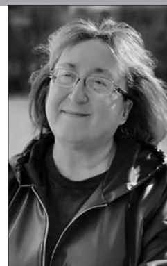
Бібліотекарь Солигорскай раённай цэнтральнай бібліятэкі