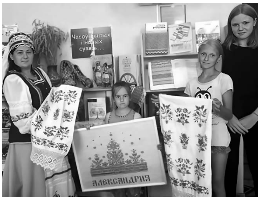
Гадзіна краязнаўства «Беларуская вышиванка»

З кнігамі серыі «Рассказы Деда Природоведа» пазнаёміў Дзень зялёнага настрою. Менавіта гэтыя кнігі былі прапанаваны для знаёмства з жывёльным і раслінным светам нашай краіны, цікавымі фактамі і