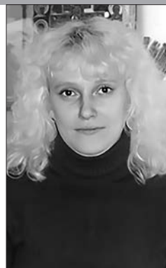
Заведующая отделом Национальной библиотеки Беларуси