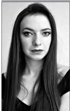
Ведущий библиограф Национальной библиотеки Беларуси