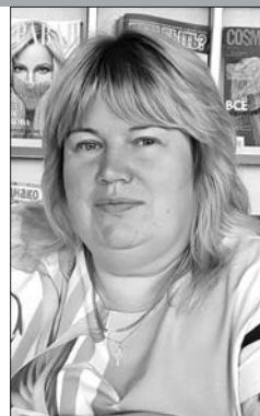
Заведующая отделом Круглянской центральной библиотеки