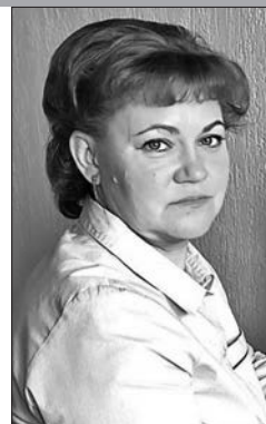
Заведующая отделом Солигорской районной центральной библиотеки