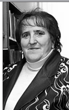
Заведующая отделом Свислочской районной библиотеки