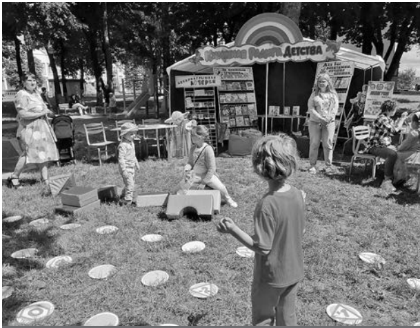
Библиоплощадка «Книжная радуга детства». 3 июля 2024 г.