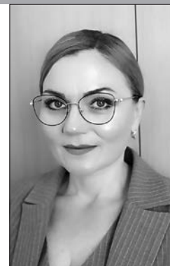
Методист Ошмянской районной библиотеки