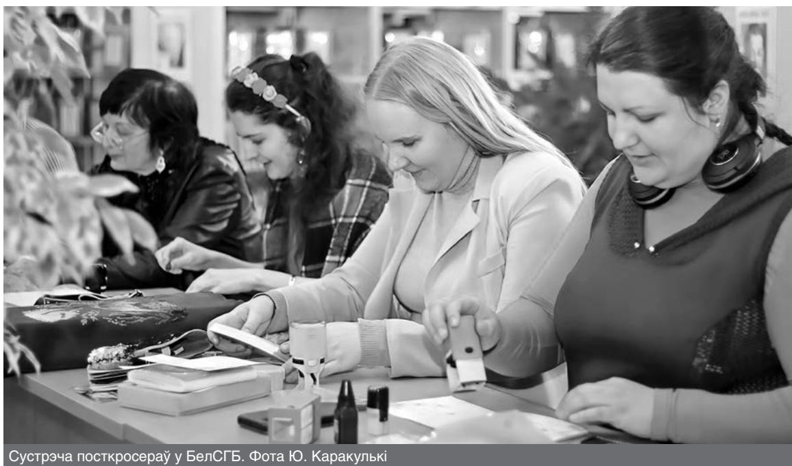
Сустрэча посткросераў у БелСГБ.

супольнасці вопыт правядзення сумеснага мерапрыемства з удзельнікамі посткросінгу стаў першым. У ім прынялі ўдзел больш за 15 посткросераў з розных рэгіёнаў Беларусі.