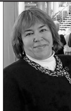
Главный библиограф Национальной библиотеки Беларуси

Каждый из нас уже в детстве мечтает, кем станет, когда вырастет. Актрисы, космонавты, летчики, врачи, продавцы, путешественники, водители – список можно продолжать до бесконечности. Мечтала и я. Вот только мою мечту сформировали книги и мамина профессия. Проводя несколько лет подряд школьные каникулы у бабушки, я была постоянным читателем детской библиотеки № 7 г. Минска, что находилась неподалеку. Сегодня мне сложно об этом судить, но, наверное, я перечитала (а читала я быстро) большую часть книг из этой библиотеки. Мне нравилось не только брать книги домой, но и читать их в читальном зале.