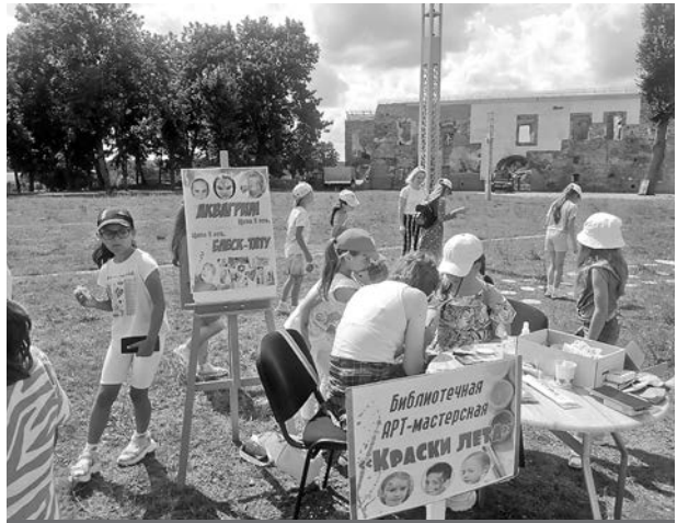
Библиотечная арт-мастерская «Краски лета».

лись услуги «Арт-мастерской», где ребятам наносили аквагрим, узоры и блеск-тату.