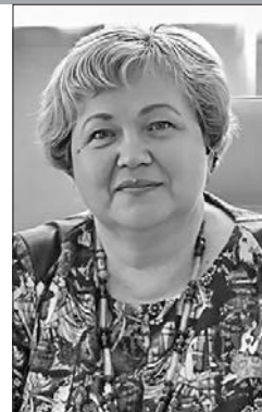
Директор Централизованной системы детских библиотек г. Минска