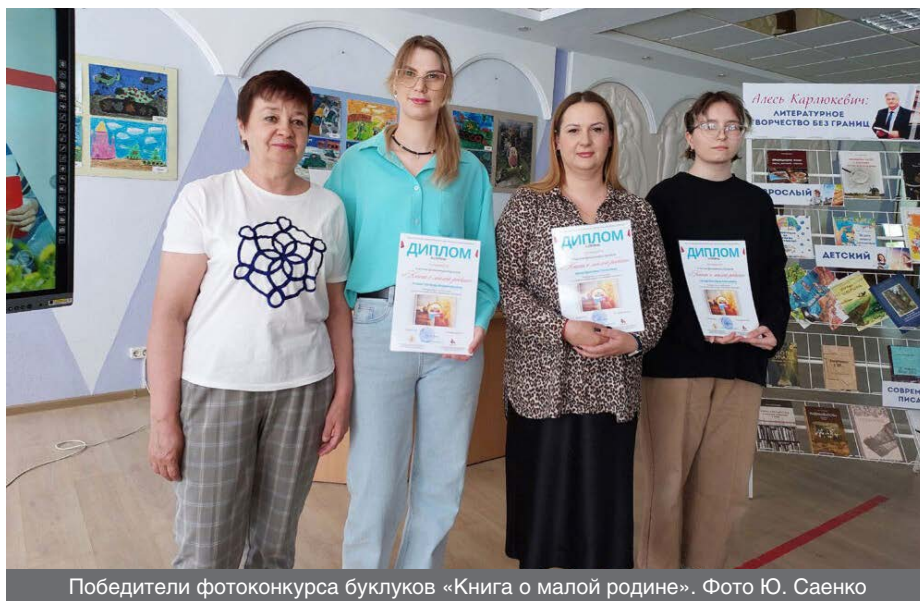
Победители фотоконкурса буклуков «Книга о малой родине».

документ. Инициатива была направлена на формирование у общественности интереса к изданиям, находящимся в фондах библиотек города и района.