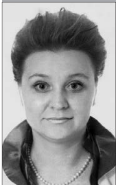
Загадчык аддзела Віцебскай абласной бібліятэкі імя У.І. Леніна