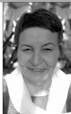
Загадчык аддзела Ганцавіцкай цэнтральнай раённай бібліятэкі імя В.Ф. Праскурава