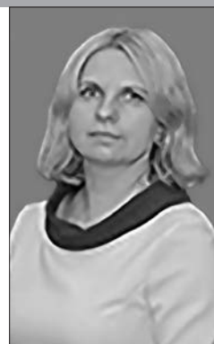
Преподаватель Могилевского государственного колледжа искусств

Стремительное развитие современных медиатехнологий выдвигает ряд новых требований к профессиональным компетенциям библиотекарей. Повышенное внимание предьявляется медиаграмотности как критерию авторитетности и квалифицированности специалиста в области библиотечно-информационной деятельности, который должен уметь полноценно использовать возможности информационного потока, проверять его значимость с учетом этических норм и гражданской позиции.