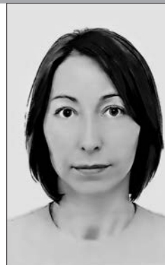
Намеснік дырэктара Віцебскай абласной бібліятэкі імя У.І. Леніна