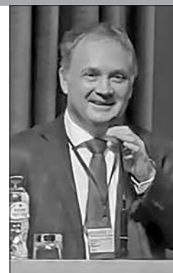
Руководитель Центра по изучению проблем информатики ИНИОН РАН, канд. филос. наук

В последнее время в библиотеках России и Беларуси получила распространение практика медленного чтения [3; 4; 5; 7]. С марта 2021 г. такие чтения проводятся в Библиотеке № 240 Объединения культурных центров Северо-Западного округа г. Москвы, где я являюсь куратором проекта «TechnoScience» [8].