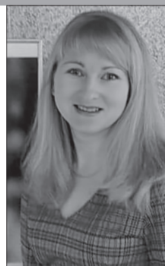
Главный библиограф Национальной библиотеки Беларуси