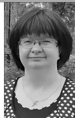
Библиотекарь Гомельской областной универсальной библиотеки им. В. И. Ленина

Семейная библиотека – это создаваемое членами семьи собрание информации, зафиксированной на материальных носителях и удовлетворяющее культурные потребности лиц, связанных родственными узами [3, с. 98–100].