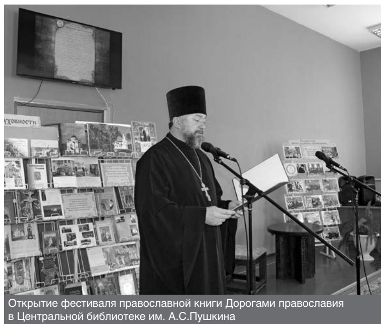
Открытие фестиваля православной книги Дорогами православия в Центральной библиотеке им. А.С.Пушкина

Час духовности «Свет православия – свет души» в библиотеке-филиале № 10 прошел