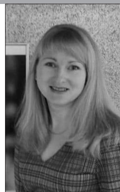
Главный библиограф Национальной библиотеки Беларуси