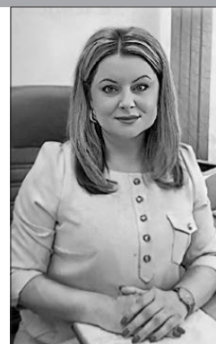
Директор Несвижской центральной районной библиотеки им. Павла Пронузо