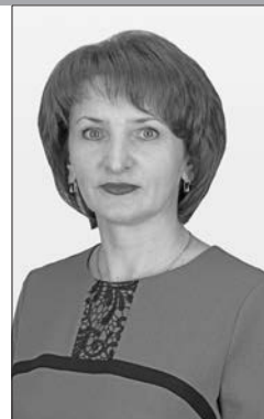
Методист Бешенковичской центральной районной библиотеки