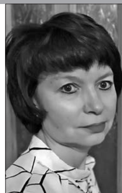
Бібліятэкар Барысаўскай цэнтральнай раённай бібліятэкі імя І.Х. Каладзева

The article provides an overview of the must visit libraries in Moscow according to young employees of the National Library of Belarus.